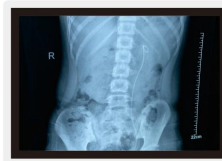
△患儿术后一月复查腹平片:结石消失无踪,无残留