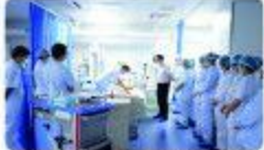
▲8月19日以来,我院开展了为期两周的“全员培训,全员参与,全员提升”的急救技能大练兵活动。