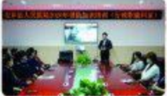
▲9月29日,该院全院党总行清房知识培训。