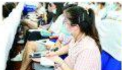
▲7月15日-16日,我院召开了为期两天的学习生岗岗前培训会,这些是我院招录的首批实习生。