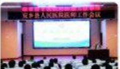
▲7月22日,召开医师工作会议。