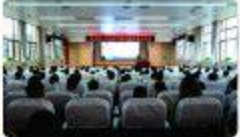
▲9月13日,医院组织专题会议,对22个临床科室急救技能进行点评。