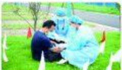
▲7月17日,我院开展了2020年突发公共卫生事件(霍乱)应急演练活动。