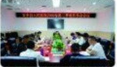
▲9月29日,召开第三季度理事会会议。