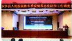
▲9月25日,我院召开秋季疫情常态化防控工作调度会。