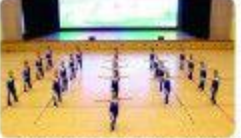
▲在第三届“健康安乡”全民运动会上,我院代表队系统性地参加了乒乓球及羽毛球比赛,均取得一名的好成绩。