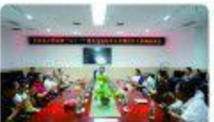
▲7月21日,我院召开“八·一”建军节退役军人及现役军人家属座谈会。